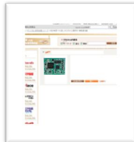
販売代行サービス CQ Web Shop