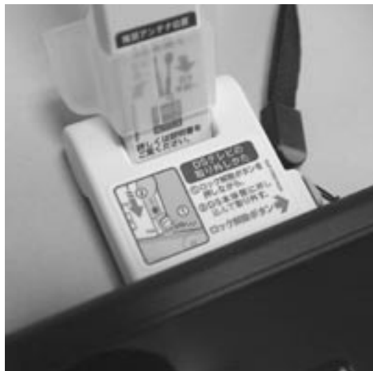
DSテレビをDSのゲームスロットに装着する