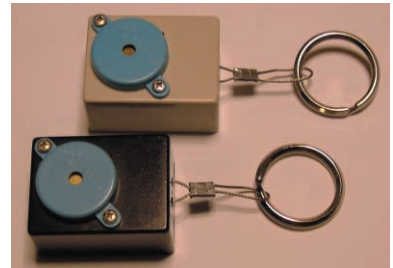
写真I お知らせキー・ホールダ(第6・4章)