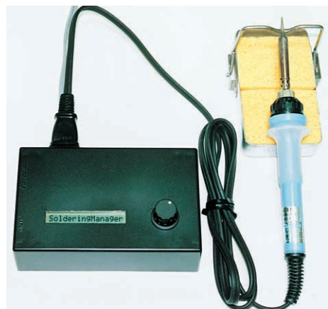
写真J はんだごて温度コントローラ(第7・1章)