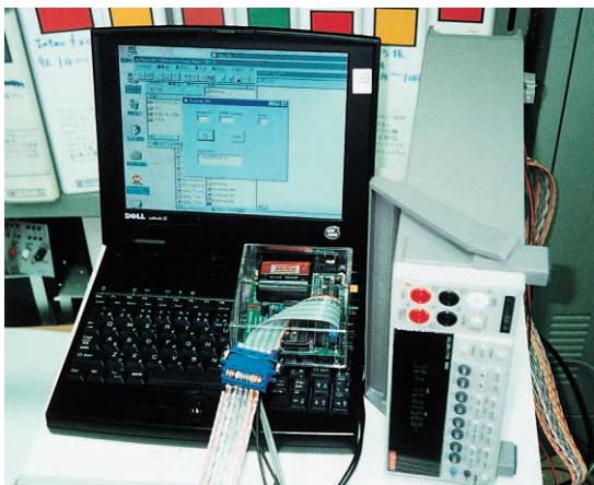
写真H シリアル・GPIB コンバータ(第5・2章)