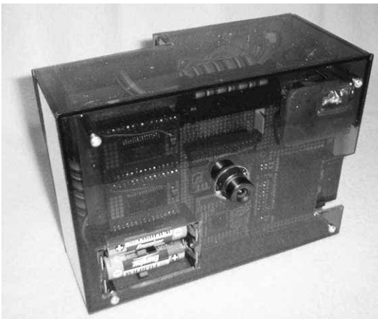
写真1 自作したデジタル・スチル・カメラの外観

表1に示す部品は、CMOSモジュールを含めすべてインターネット経由で個人で入手できます。