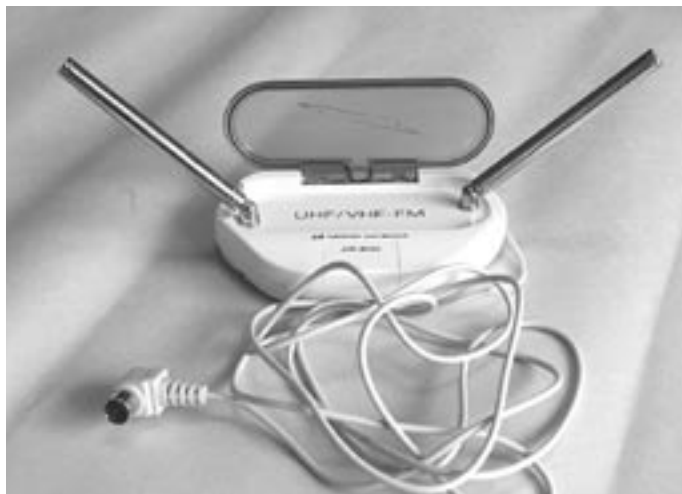
TVの上や周辺の棚などに配置して使う

地デジ電波は大きな送信電力と見晴らしの良い山の上、高台または専用の送信鉄塔などに設置されたアンテナから送出されています。ある程度の距離であれば、室内アンテナでも受信可能な場合もありますが、天候などによる受信状態の変動を受けやすく、受信画面が安定しないこともありますので、電波の強い地域以外では簡易的なアンテナとして使いましょう。