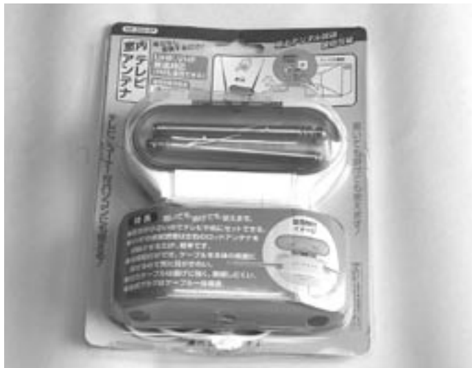
室内・卓上アンテナの例