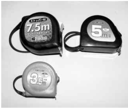
写真2-5-1 巻き尺の例 3.5m、5m、7.5mのものを入手できた。

100～300円程度で購入できる巻き尺には数種類があり、短いものでは1m、長いものでは7.5mというものもあります。必要な長さは、目的とする周波数によ