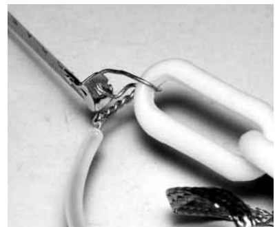
写真2-5-6 巻き尺先端の穴にφ0.9の銅線を通して固定する

て変わります。それに合わせて、巻き尺の種類を選択することになります。21 MHzまでなら3.5m、14 MHzまでなら5mのタイプを用意します。ただし、巻き尺自体の電気的特性は良好ですが、水分が付着すると簡単に錆びるので、長期間にわたって屋外で利用することはできません。