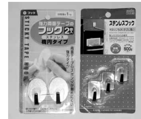
写真2-5-2 ステンレス製の粘着剤付きフック メジャーの幅に応じて大きさを使い分ける。