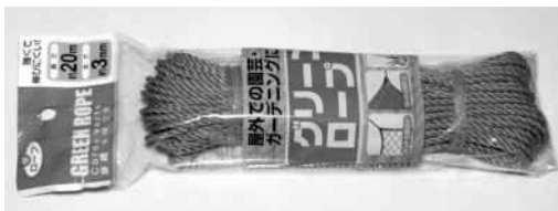
写真2-5-5 園芸用の太さ3mmのロープ 商品名は「グリーンロープ」で、ナイロン製。