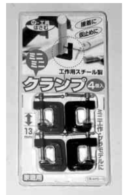
写真2-5-3 超小型のクランプ 商品名は「ミニミニ クランプ」。