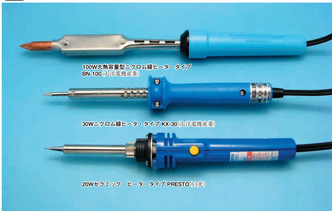
写真2 はんだごては電力によって使い分ける

はんだごては、基板、部品の端子、リード線などの母材と糸はんだを、 240\sim 250^{\circ}\text{C} の温度まで上げる役割をもっています。母材やはんだの温度上昇は、こてのワット数やこて先の形状、また母材の大きさや形状によって違ってきます。電子工作用には熱容量(電力)の小さいはんだごてを選びます。