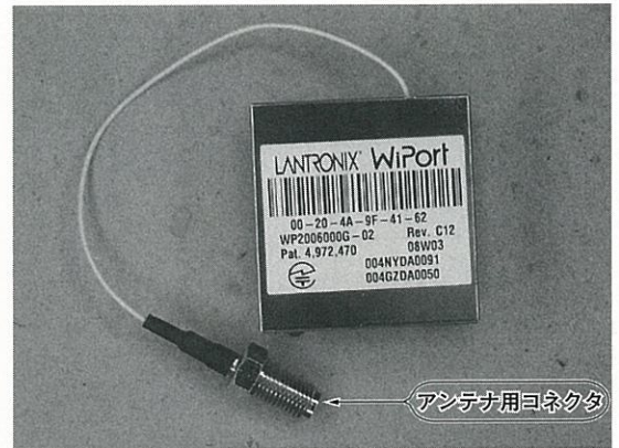
写真 2 無線 LAN 接続モジュール WiPort の外観

WiPort の外観を写真 2 に示します。500 円玉より一回り大きいサイズ (3.25 × 3.39 × 1.03 cm) の金属ケース内部に、無線 LAN 機器を構成するのに必要なハー