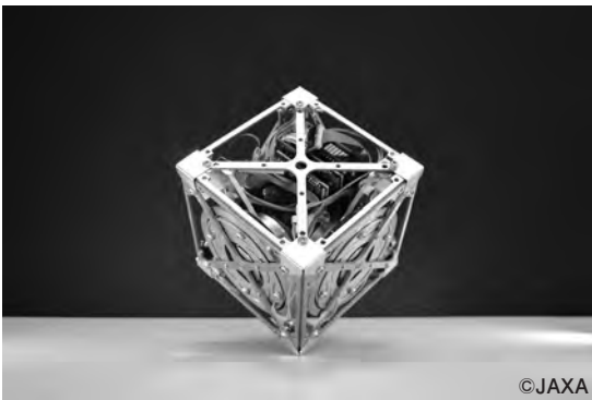
写真1 本連載では、点で静かに倒立する立方体「3軸姿勢制御モジュール」の運動を解析中

今回(最終回)は、運動量保存則とエネルギー保存則に基づき、3次元モデルにおいて、エッジ(辺)倒立から