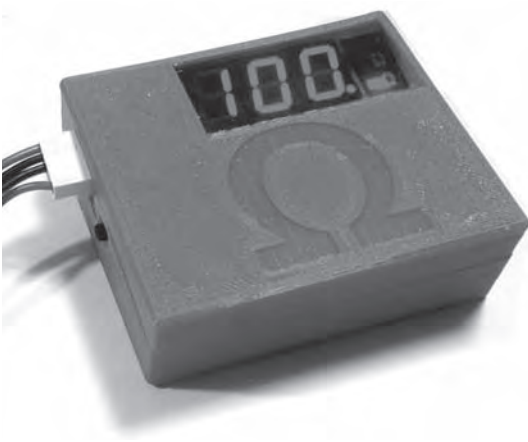
(a) ミリオーム計の外観

微小抵抗値は、図1に示すようにCVCC電源…定電圧・定電流電源と電圧計を使えば測定することができます。しかし、重い電源をもってきてセットアップしなければいけないのは不便です。もちろん微小抵抗を計測するための専用測定器は存在しますが、どこの実験室にもあって手軽に使えるとまでは言えません。3桁程度の分解能でいいので、ハンディ・テスタ感覚でミリオーム( m\Omega )単位の抵抗値がわかると何かと便利